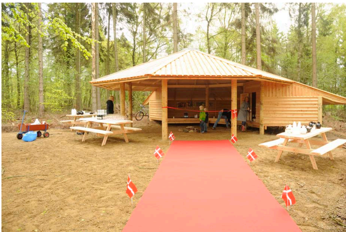
En tilsvarende grillhytte ved Ry, som benyttes af daginstitutionen Kildebjerg Børnehus

Ad 5. Partnerskabet vil gerne afmærke en rundtur gennem Hov by og helt til Hølken. Afmærkningen består i pæle med pile, der fortæller, hvornår man skal dreje til højre eller venstre. Ruten vil gå via eksisterende veje og stier, og der vil enkelte steder blive opsat borde/bænke-sæt, hvor man kan nyde udsigten over vandet.