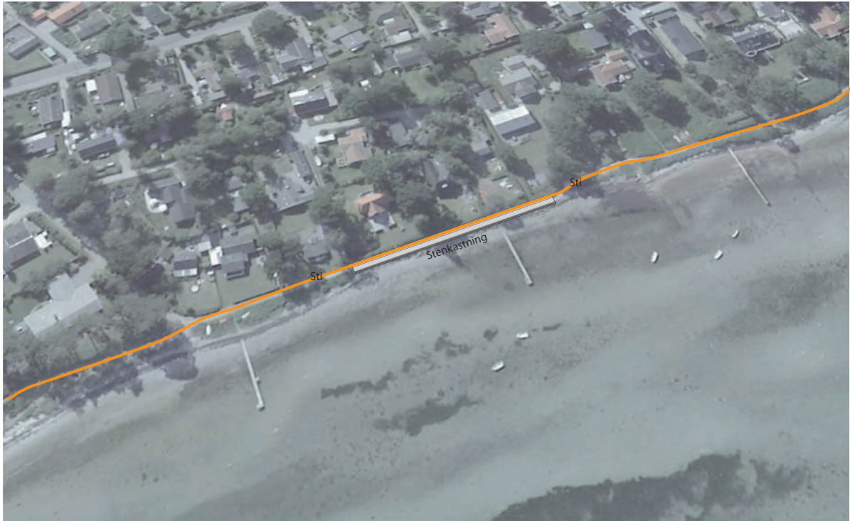
Oversigtsfoto med stenkastningen markeret

Ad 2. På strækningen langs stranden fra Hov Søsportscenter og til havnen har partnerskabet ønske om at forbedre den eksisterende sti, så den får en bedre og fastere grusbelægning, som er egnet til kørestolsbrugere. Stien vil i høj grad få samme karakter, som den eksisterende sti og anlægges i 2-2,5 meters bredde. Over stenkastningen anlægges stien i 3 meters bredde. Stien skal godkendes i henhold til kommunens lokalplaner, og enkelte private grundejere skal også informeres mere om denne del af projektet, da det kræver opbakning fra flere sider.